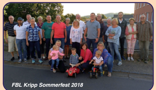
FBL Kripp Sommerfest 2018