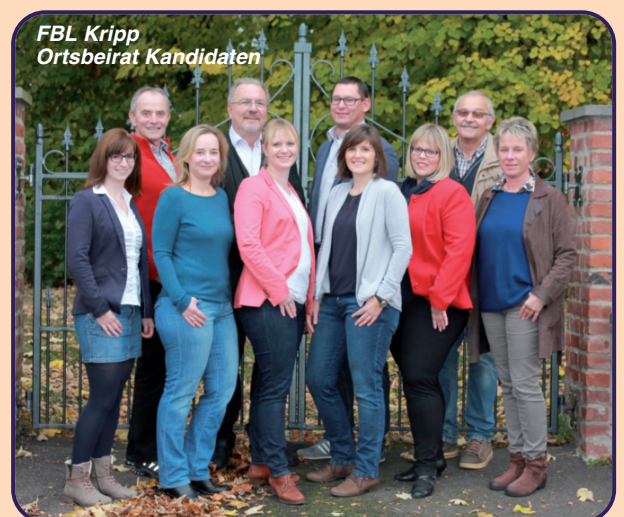
FBL Kripp Ortsbeirat Kandidaten