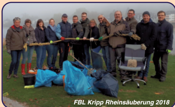
FBL Kripp Rheinsäuberung 2018